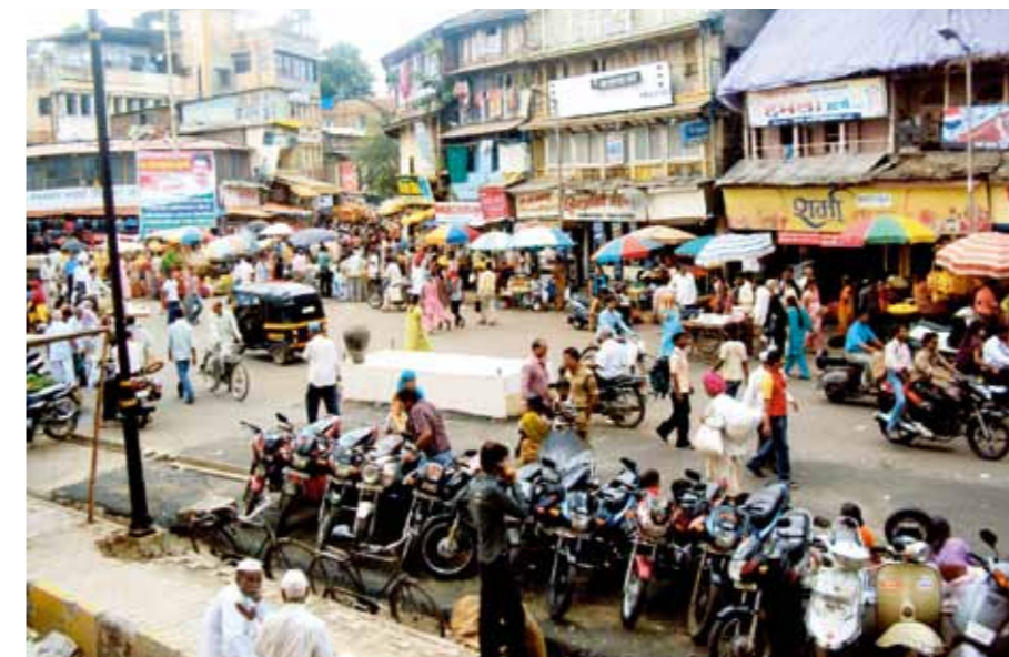
Gadeliv i Mumbai.