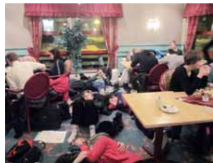
Husly - efter en tur i grøften.

lange timer, endelig hjemad mod Rejsby. Vi ankom på skolen klokken 04 hvor de fleste elever blev hentet af deres forældre. Vi var begge to nogle af de få, der sov på skolen. Vi fik morgenmad og blev hentet op af formiddagen. Selvom vi godt kunne have undværet den voldsomme oplevelse på turen hjem, så havde vi alligevel en fantastisk tur. Vi fik en masse gode grin ud af de små uheld på ski og i sneen, og de tætte bånd, som vi allerede har opbygget gennem året blev styrket endnu mere. Skituren med Rejsby Europæiske Efterskole 10/ 11 vil være et minde for livet, og endnu engang fik vi skolens motto bekræftet: Det handler ikke om, hvordan man har det, men om hvordan man tager det!