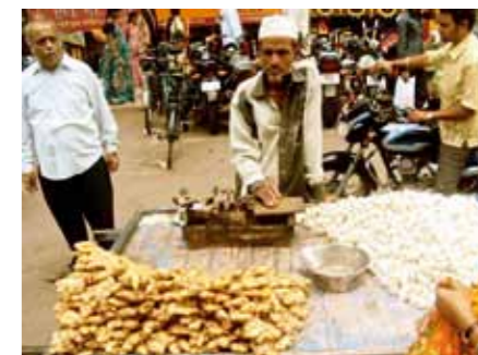
Bazaren i Pune.

Med et akademisk skift til en international skole og IB og 80 forskellige nationaliteter, kommer der også et skift i modersmål. Det handlede om at være fuldkommen flydende på engelsk med det samme, og hvis man ikke var det, så blev man det. En udfordring for visse nationaliteter (vi