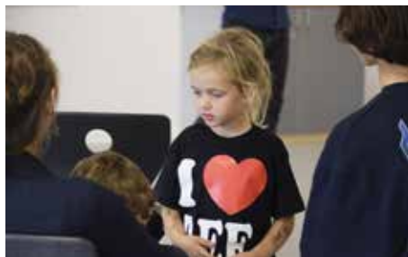
SØSKENDEWEEKEND SIDE 3