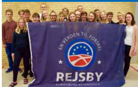
EUROSCOLA SIDE 6