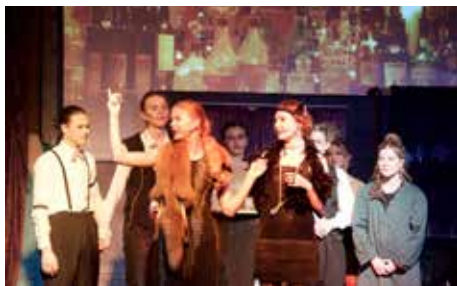
DRAMAUGEN SIDE 2