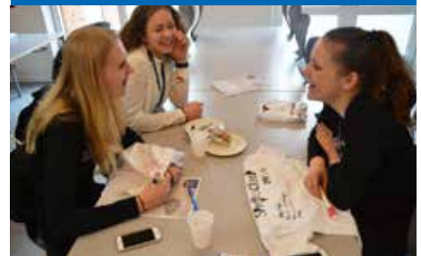
SPROGCAMP 2016 SIDE 7