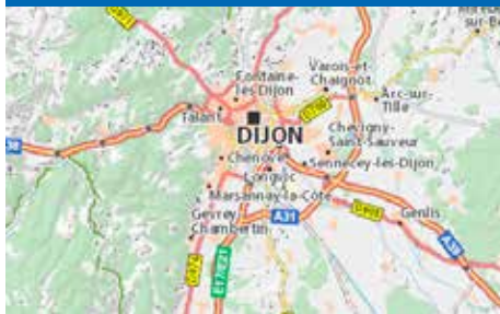
BESØG FRA DIJON SIDE 5