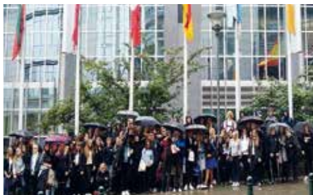
BRUXELLES-LUXEMBOURG SIDE 2-4