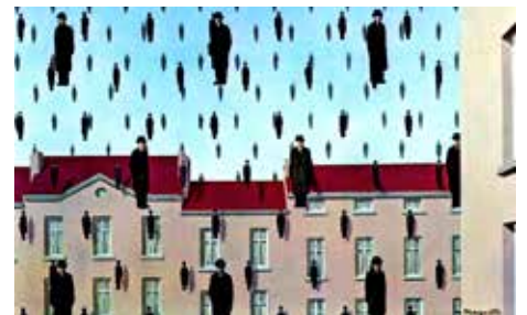
MAGRITTE-MUSEET SIDE 4