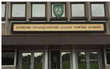
BESØG PÅ SHAPE SIDE 4