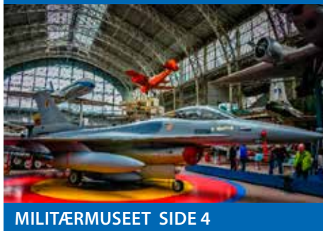
MILITÆRMUSEET SIDE 4