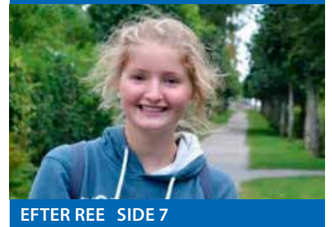
EFTER REE SIDE 7